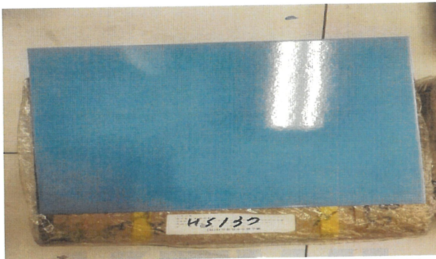
<시험 전 시험품 사진>